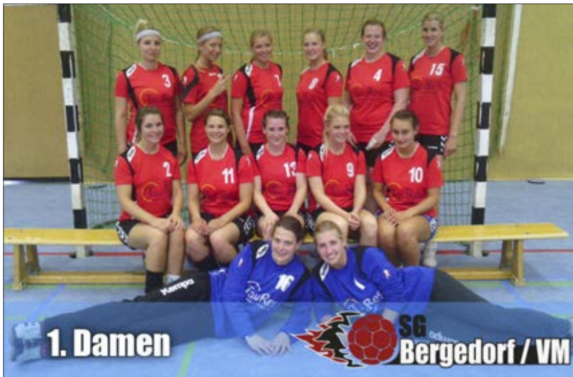
Die Mannschaft der SG Bergedorf/VM in der Saison 2013/14.