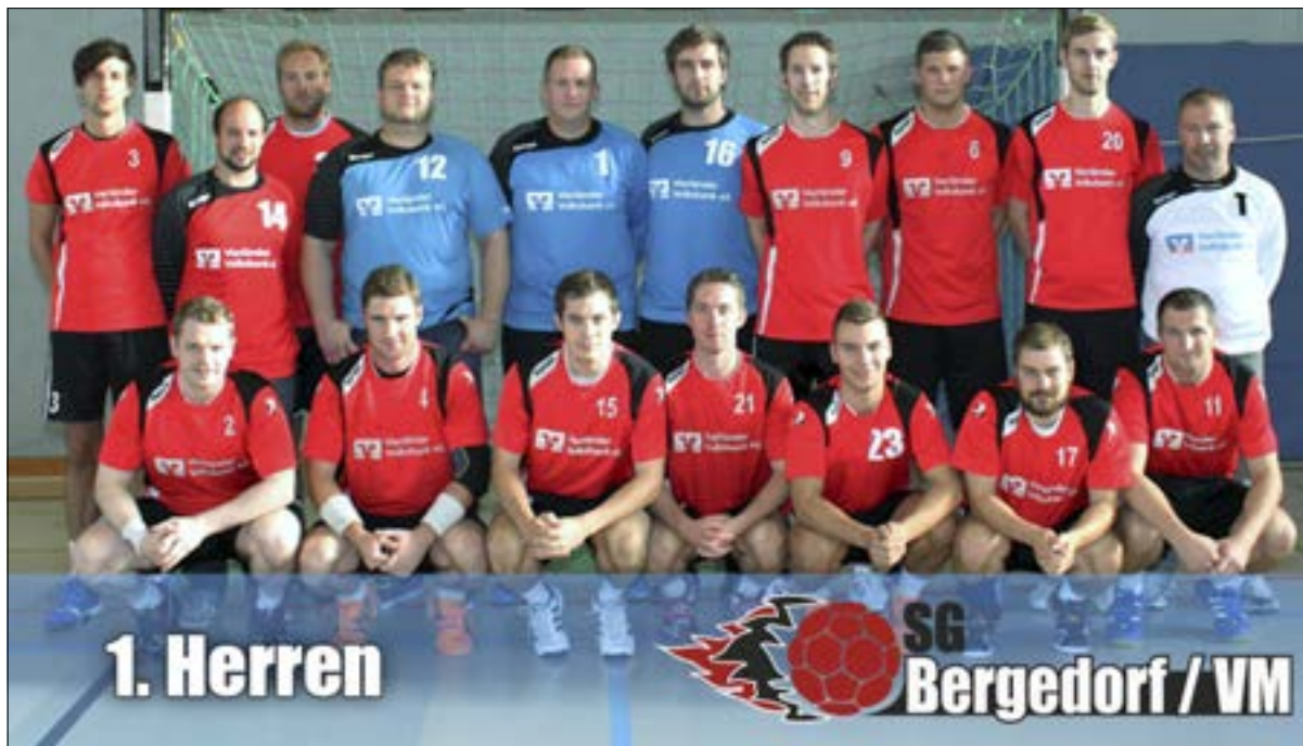
Die Mannschaft der SG Bergedorf/VM in der Saison 2013/14.