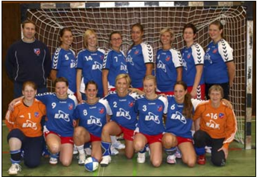
Wollen zwei Punkte gegen den Tabellenführer Wandsetal: Die 2. Damen des ATSV.

Wir starteten etwas unkonzentriert in die erste Hälfte und machten da weiter wo wir am Dienstag aufgehört hatten - mit Ballverlusten. Man hätte meinen können, der Ball ist heiß. Doch im Gegensatz zum AMTV konnte die Mannschaft von Eilbeck unsere Unkonzentriertheit nicht zu ihren Gunsten nutzen.